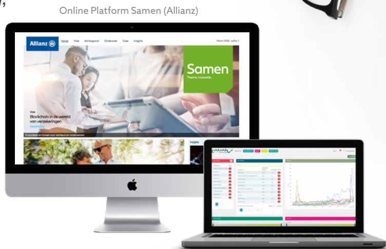
Online Platform Samen (Allianz)

Contentstrategie • Middelenmix • Concepting Formats • Distributie