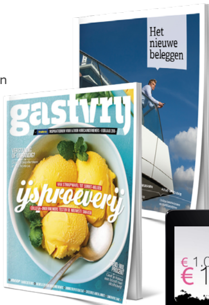
Gastvrij (Makro) • Het nieuwe beleggen (ABN AMRO MeesPierson)

Contenture is een full-service en data driven communicatiebureau. Ons team bestaat uit 25 specialisten: conceptontwikkelaars, strategen, projectmanagers, vormgevers, data-analisten, animatoren, nerds en taalkunstenars.