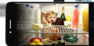
Visual Journey Miljonairs-rapport (Van Lanschot)