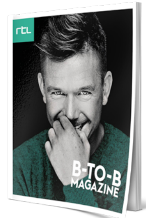
B-to-B magazine (RTL)