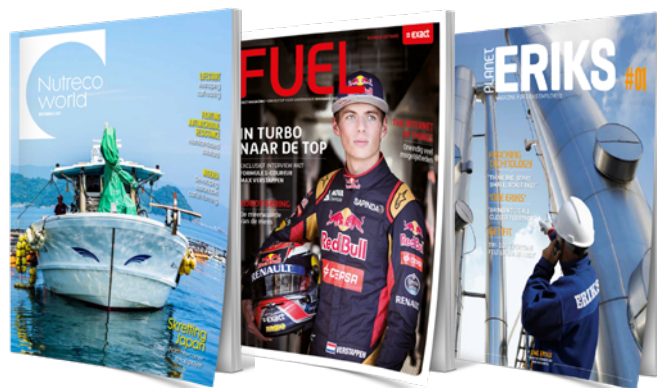
Nutreco World (Nutreco) • FUEL (Exact) • Planet ERIKS (ERIKS)

Contententure biedt een scala aan diensten en producten. Van strategie tot concept, van data-analyse tot relatie-magazine en van corporate movie tot contentplatform.