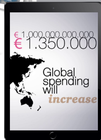
Animatie The Digital Revolution (PwC)