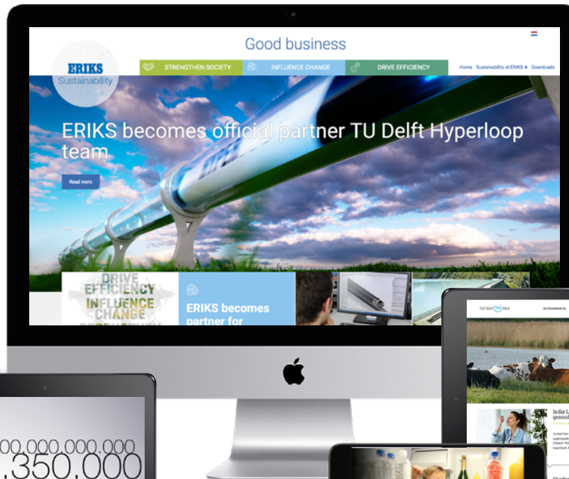
Sustainability Report (ERIKS)